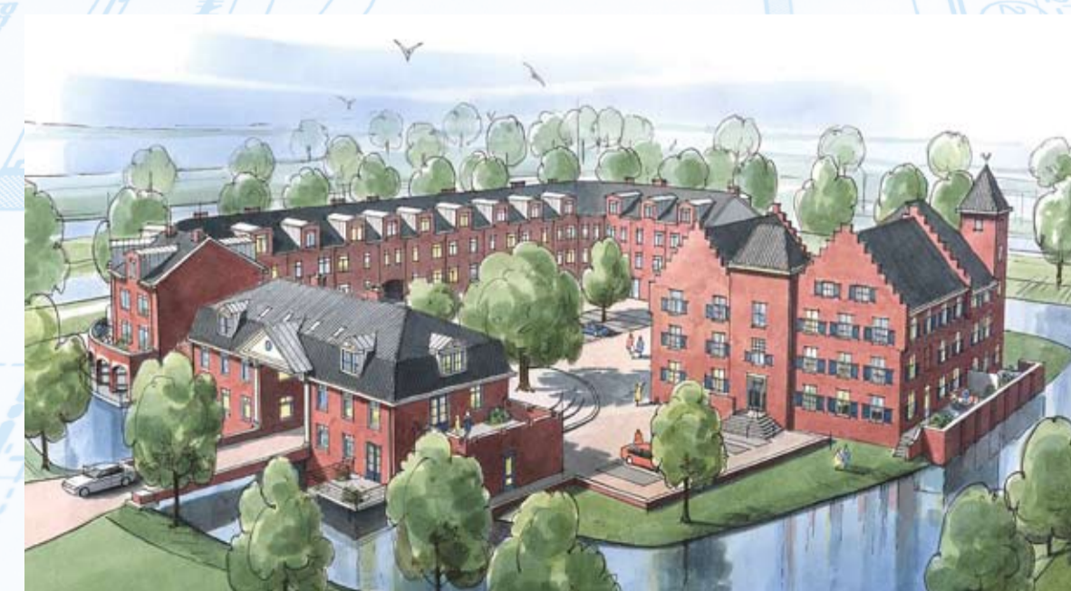
Historisch plan 't Slot in Bergambacht

Desalniettemin ben ik toch blij dat wij nu met ons bedrijf en alle keurmerkhouders een positief signaal afgeven naar de markt en de overheid om de gewenste kwaliteit van de consument te waarborgen. Nu de overheid nog!